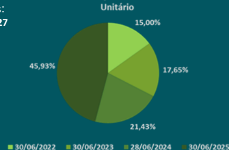
Percentual de Amortização do saldo do Valor Nominal Unitário

Saldo devedor CRA Sênior: R$ 29.655.288,38 Mezanino: R$ 13.709.873,81 Subordinada: R$ 9.832.411,30